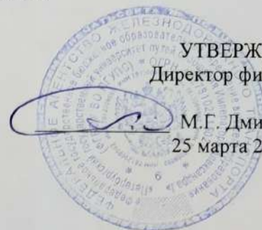
График промежуточной аттестации студентов специальности

23.02.01 Организация перевозок и управление на транспорте (по видам) на 2-й семестр 2025/2026 учебного года.